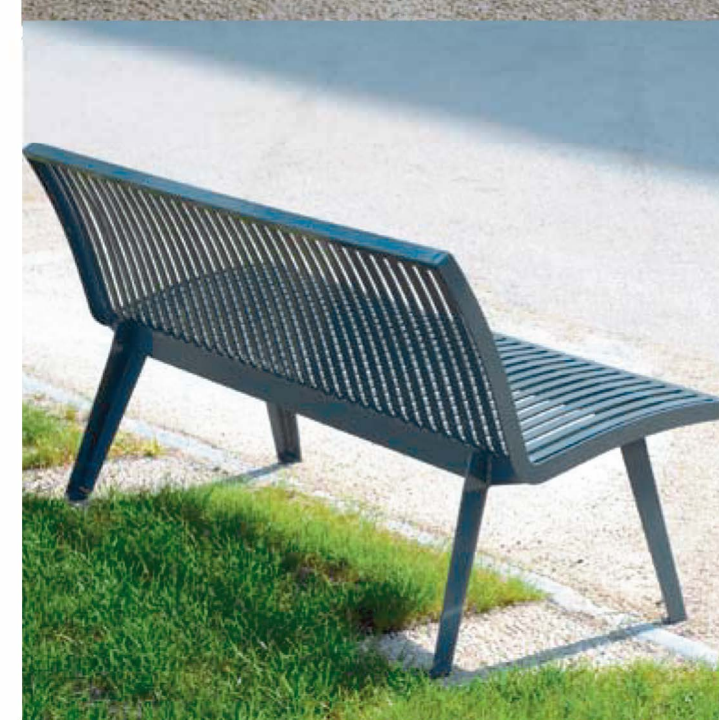
Corbeille type AREA LISBONNE Existe assise pour 3 ou pour plus