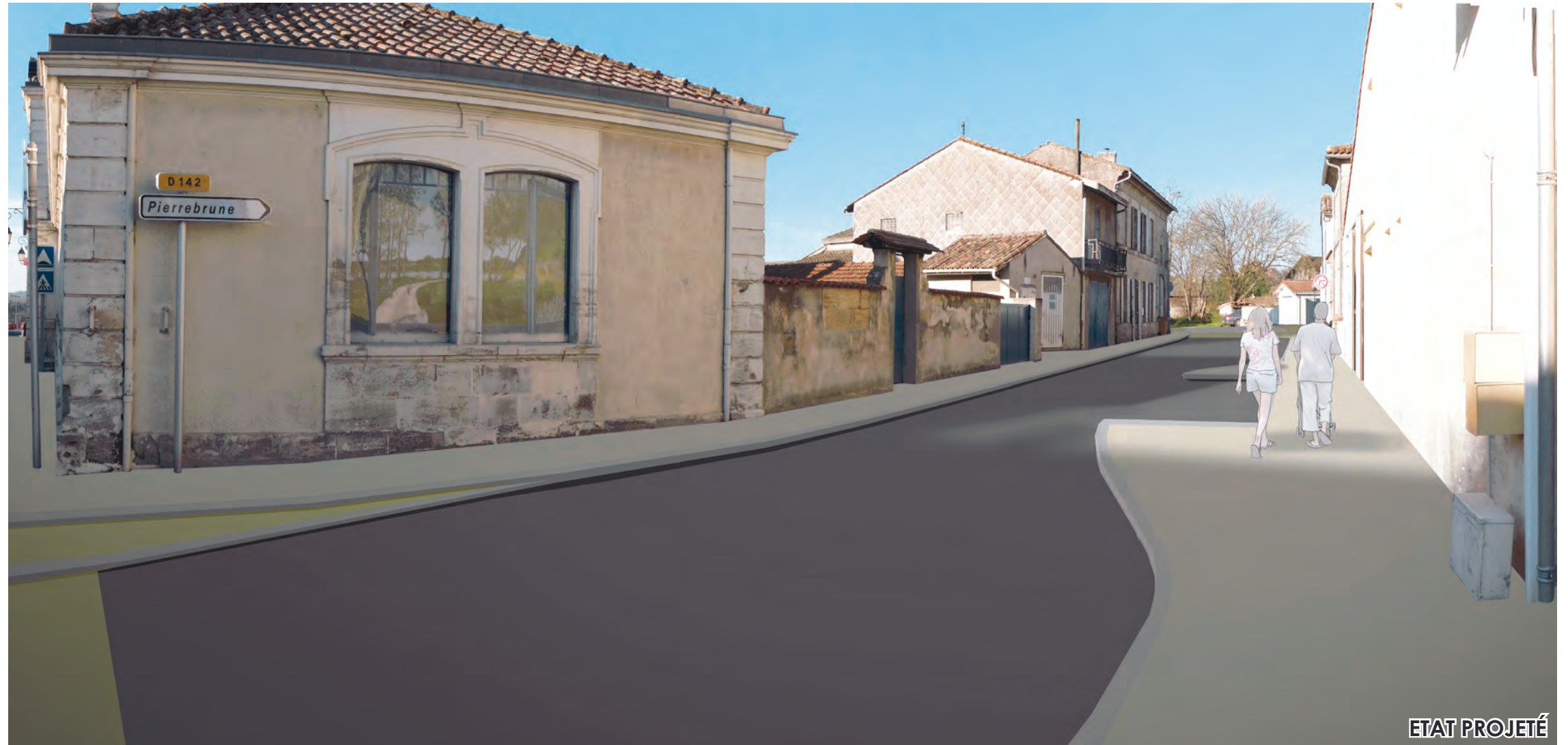
Route de Pierrebrune (R.D.142) LARUSCADE TRANCHE 3 - AVP - Décembre 2015