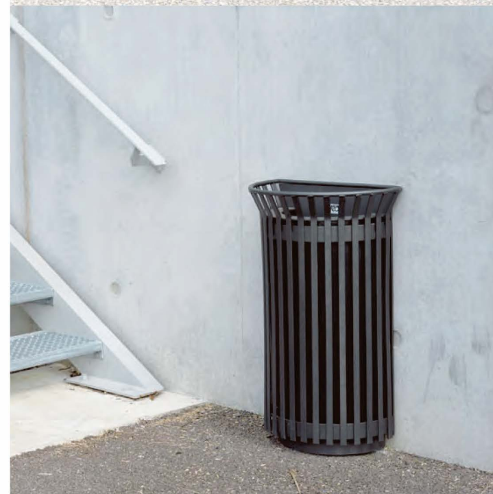
Corbeille type AREA TULIPE Existe en élément isolé ou pour pose contre un mur