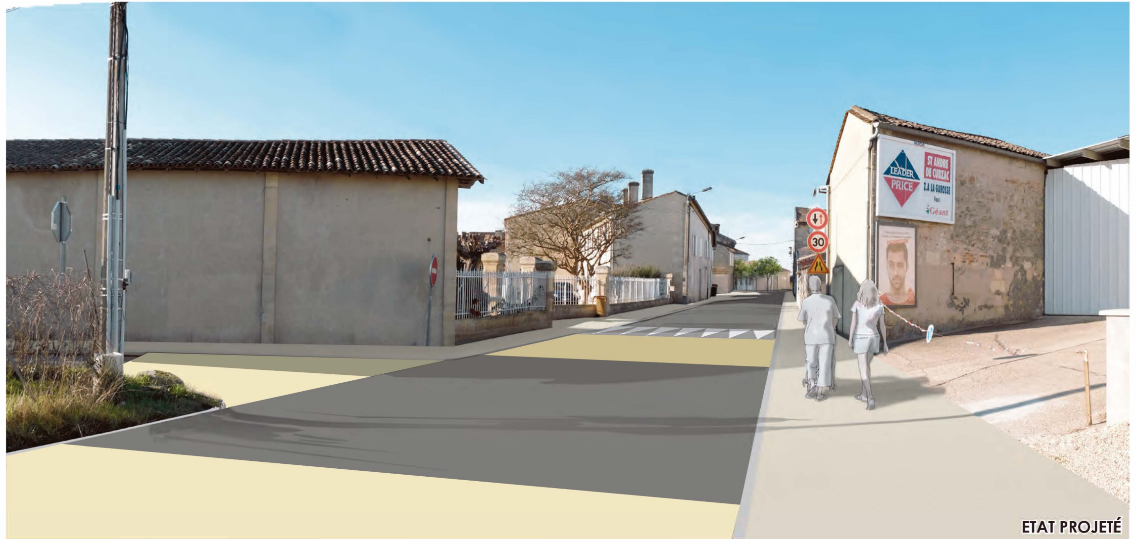
Route de Marsas (R.D.142), Variante : Carrefour - Plateau sur-élevée LARUSCADE TRANCHE 3 - AVP - Décembre 2015