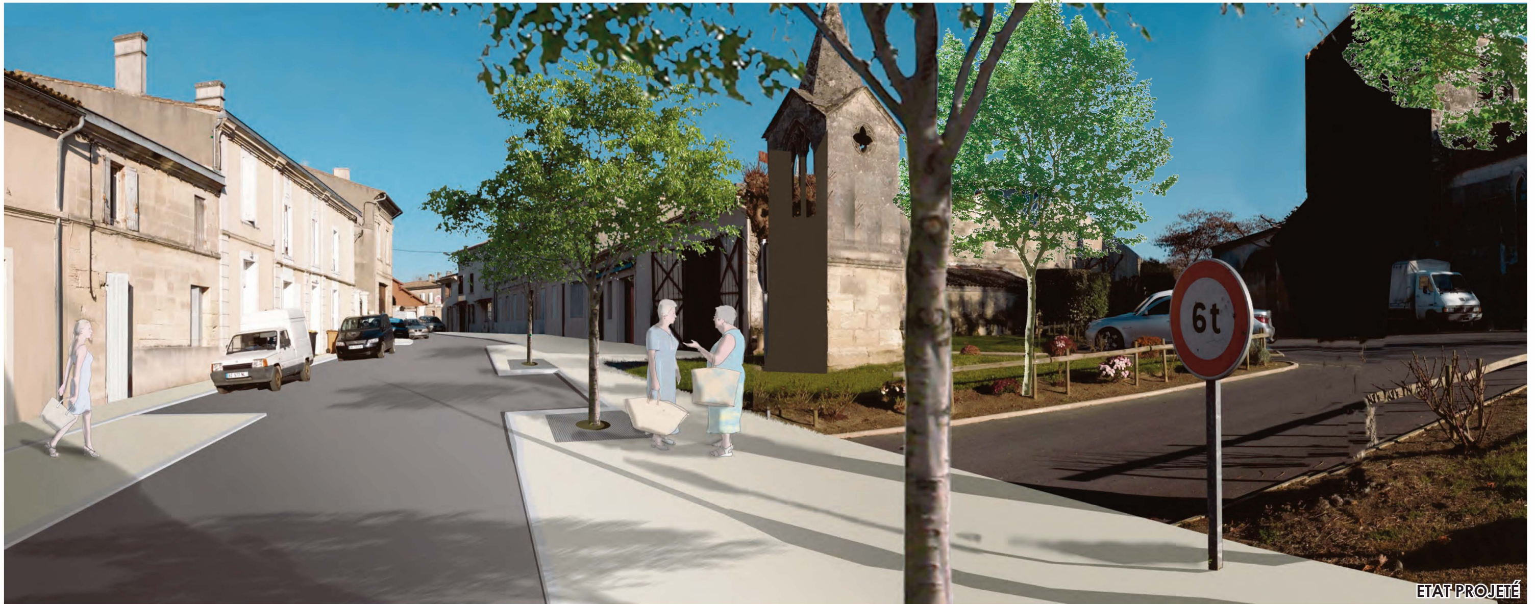
Rue de l'Eglise l'église LARUSCADE TRANCHE 3 - AVP - Décembre 2015