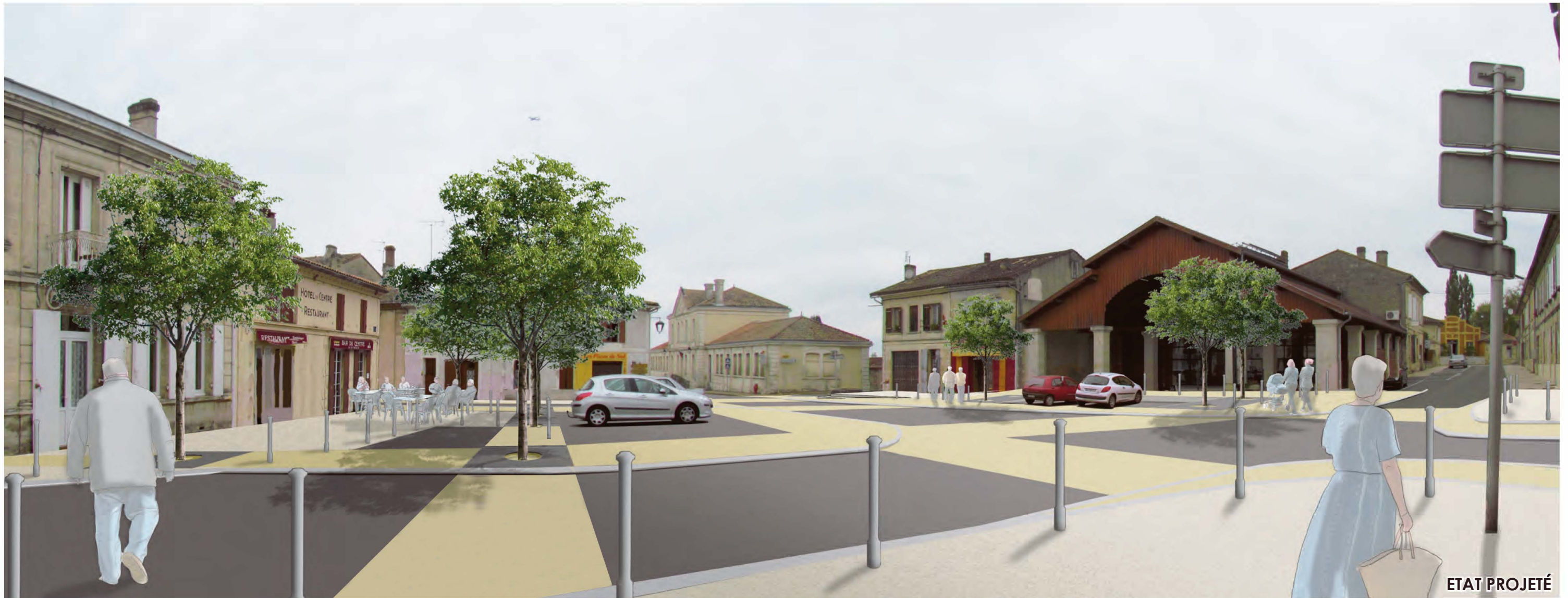
Place du 19 mars 1962 LARUSCADE TRANCHE 4 - AVP - Décembre 2015