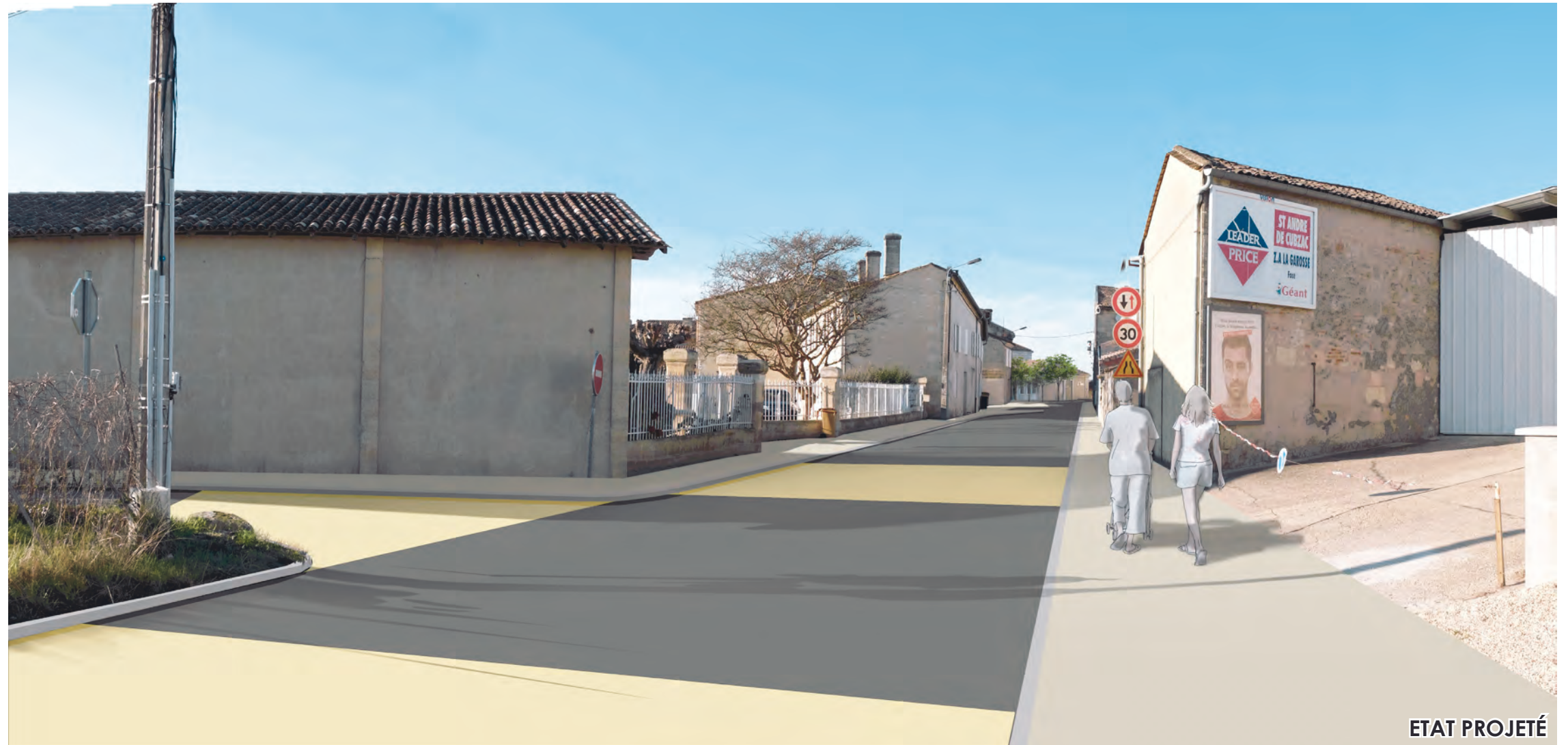
Route de Marsas (R.D.142) LARUSCADE TRANCHE 3 - AVP - Décembre 2015